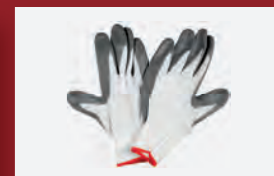
Zum Schutz der Hände vor Schmutz