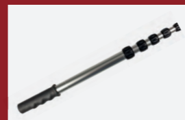
2 m Teleskopgriff für schwer zugängliche Stellen